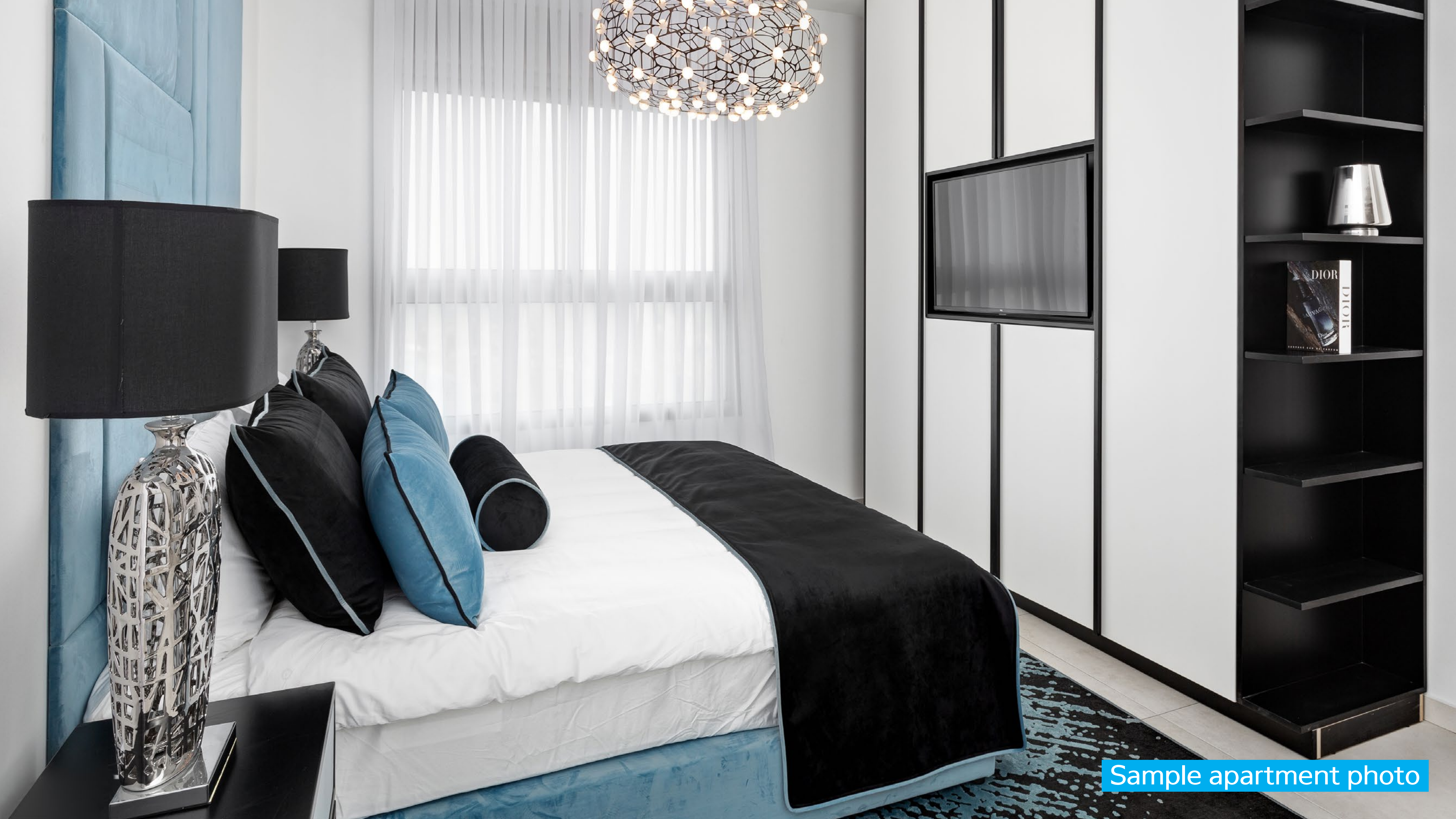
Sample apartment photo