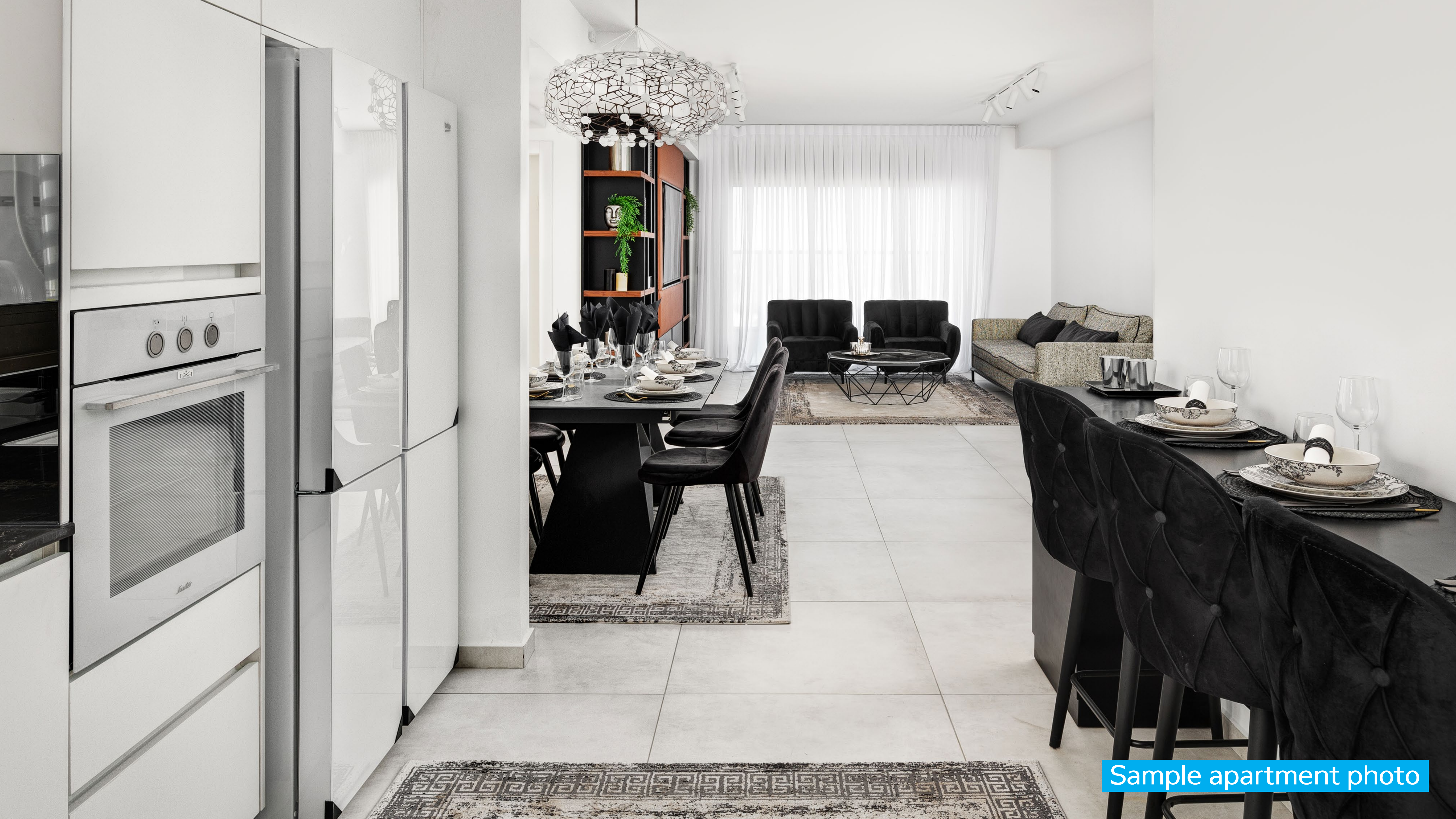
Sample apartment photo