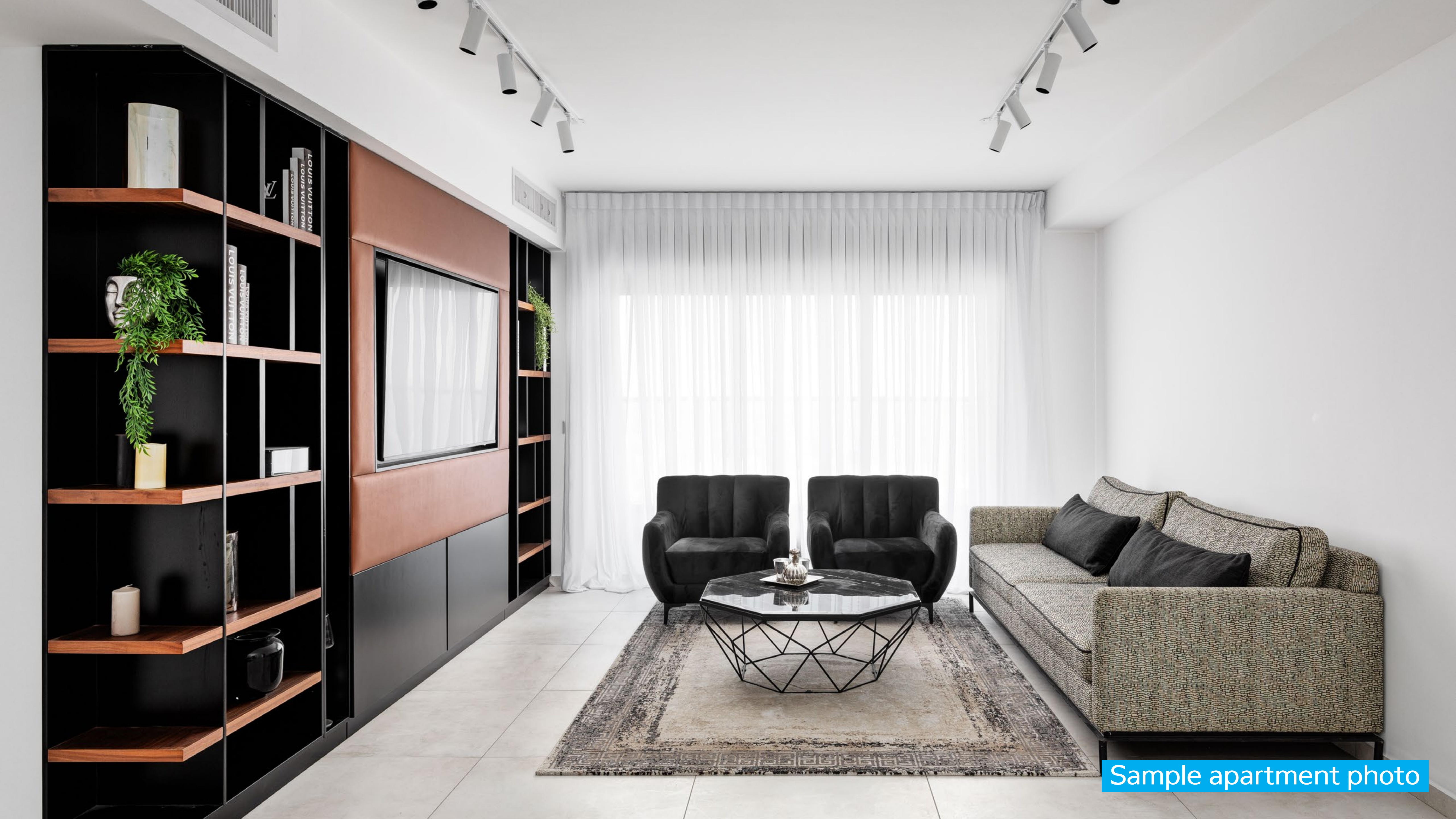
Sample apartment photo