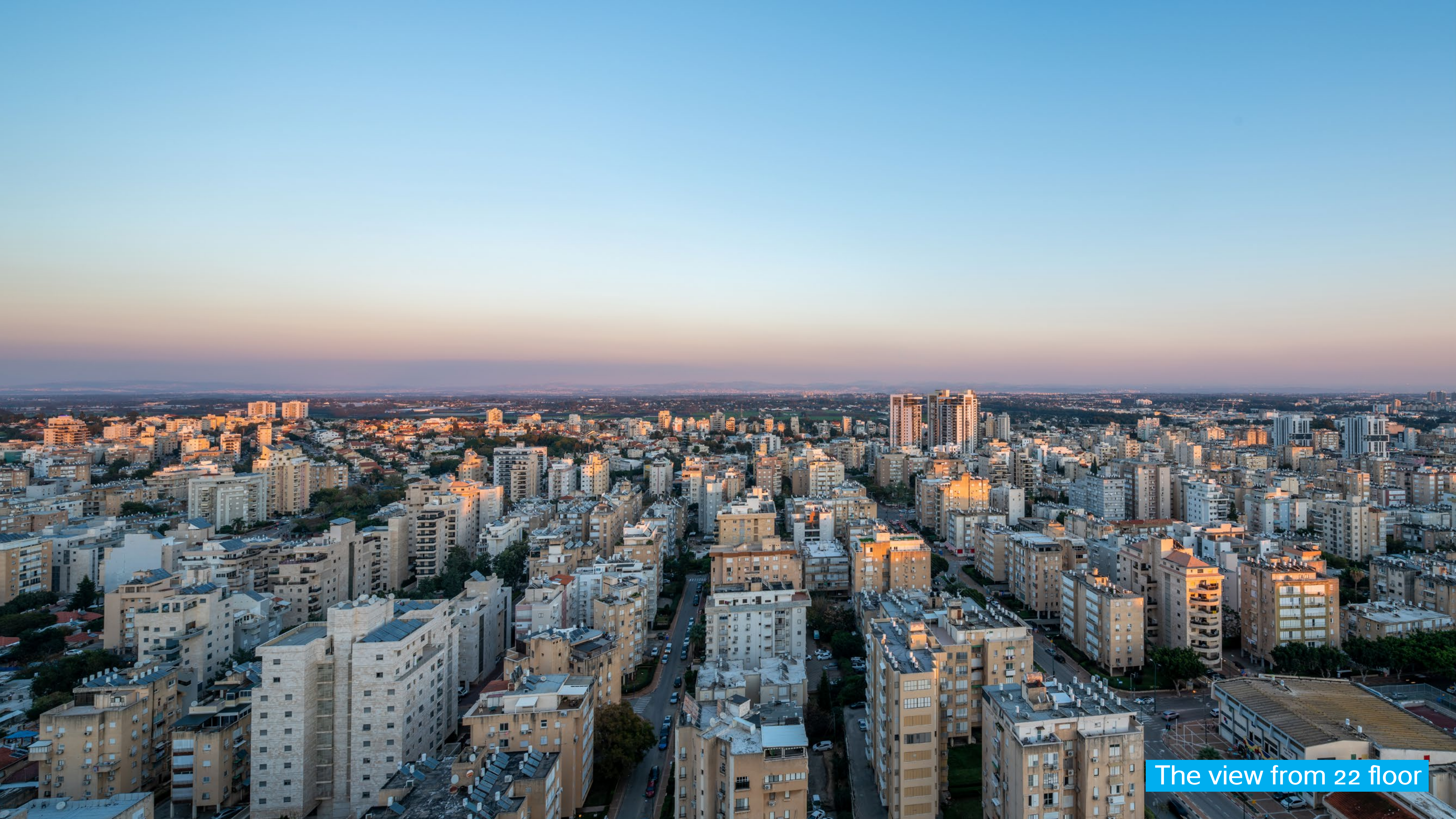
The view from 22 floor