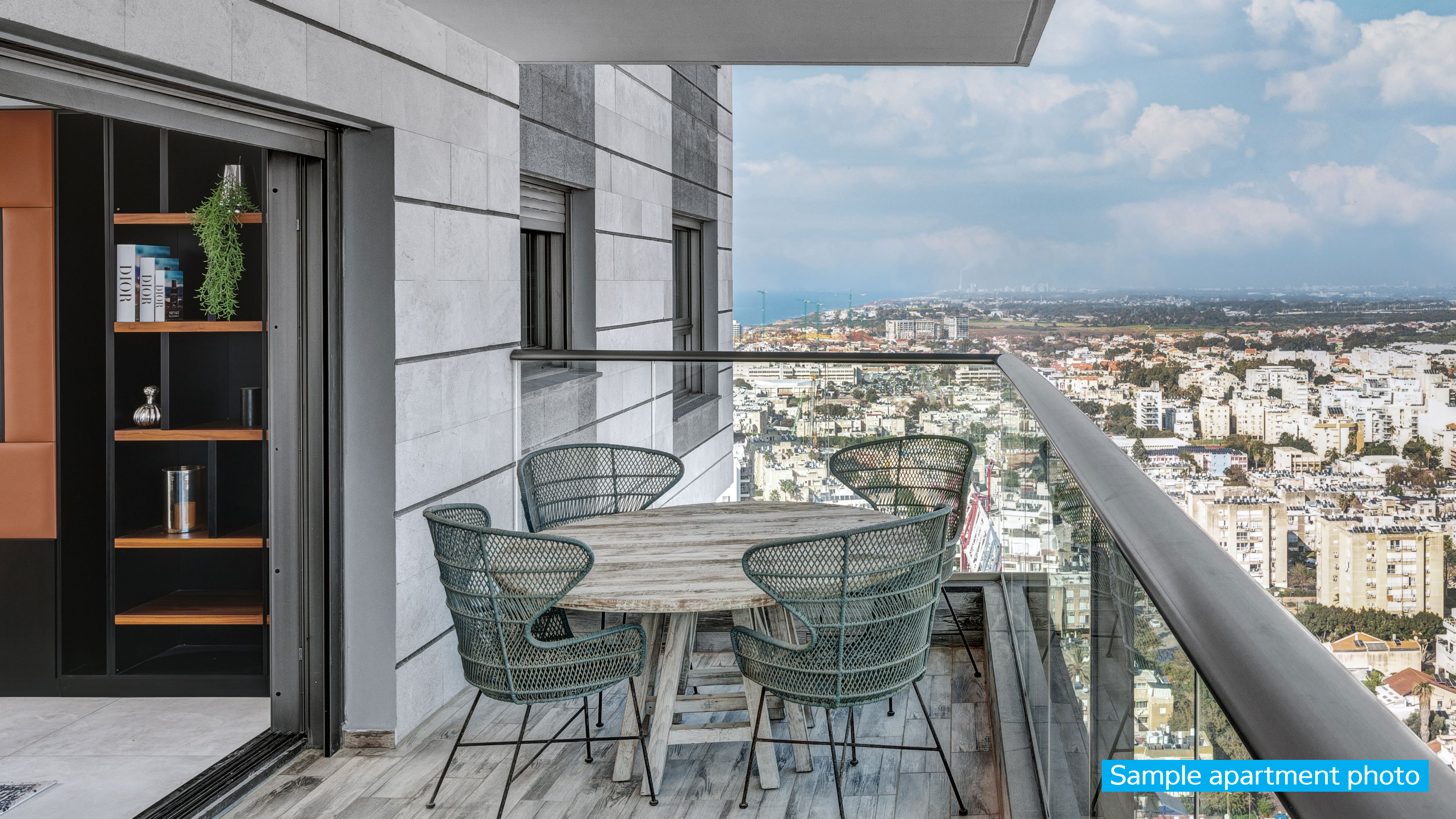
Sample apartment photo