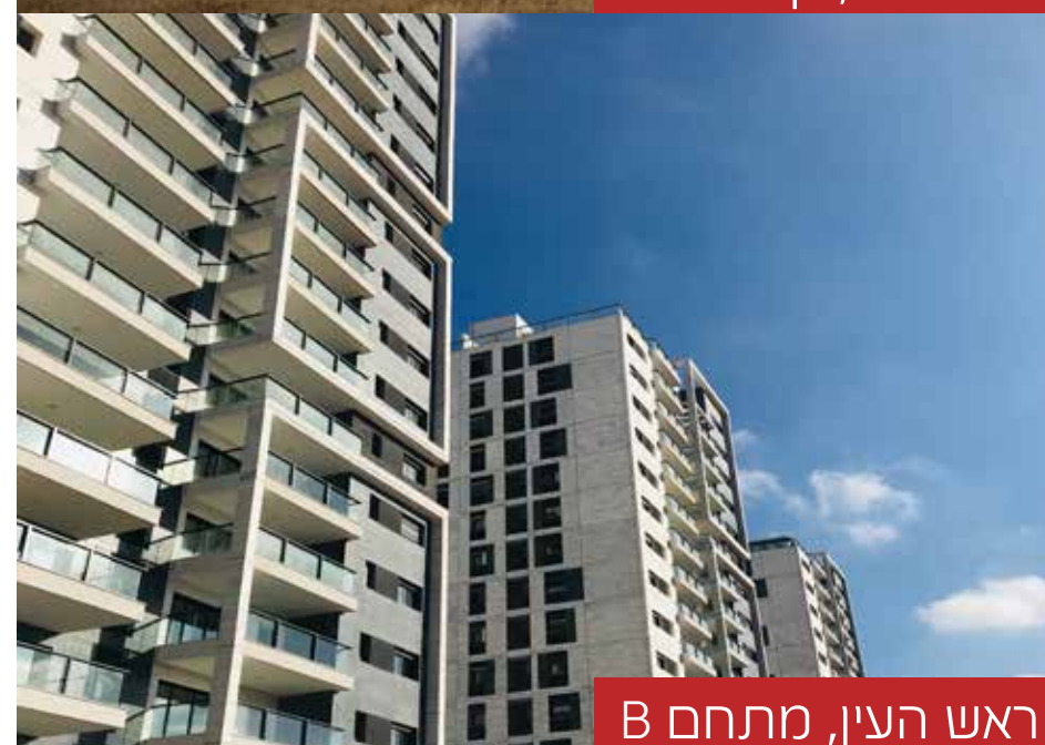
ראש העין, מתחם B