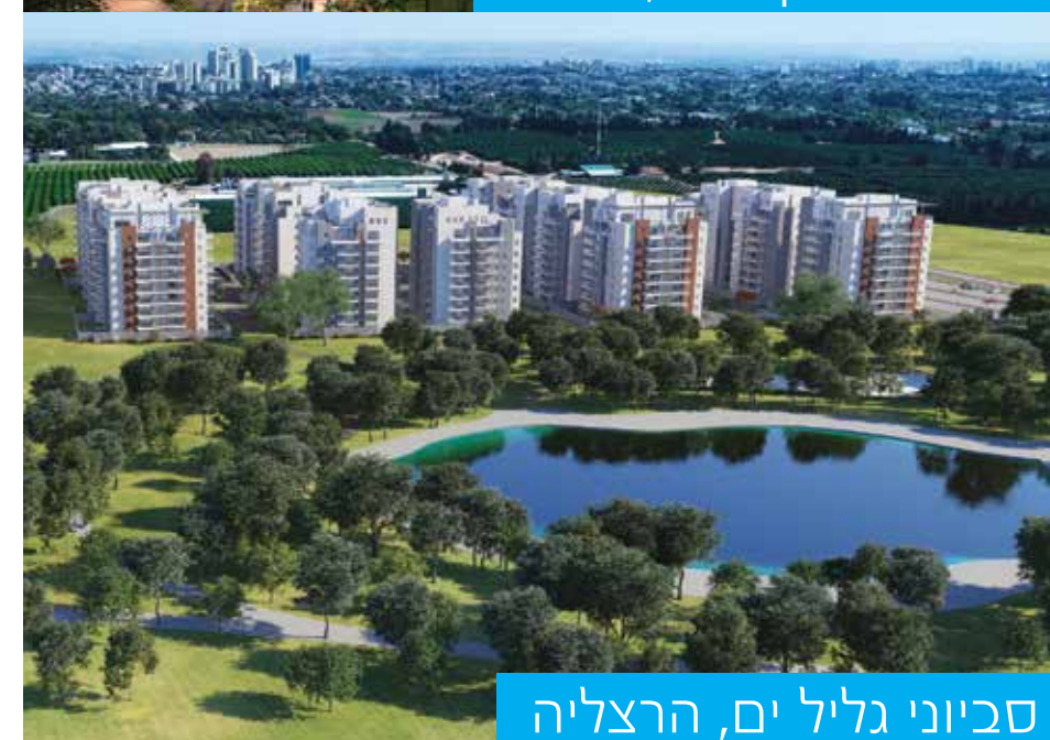
סביוני גליל ים, הרצליה