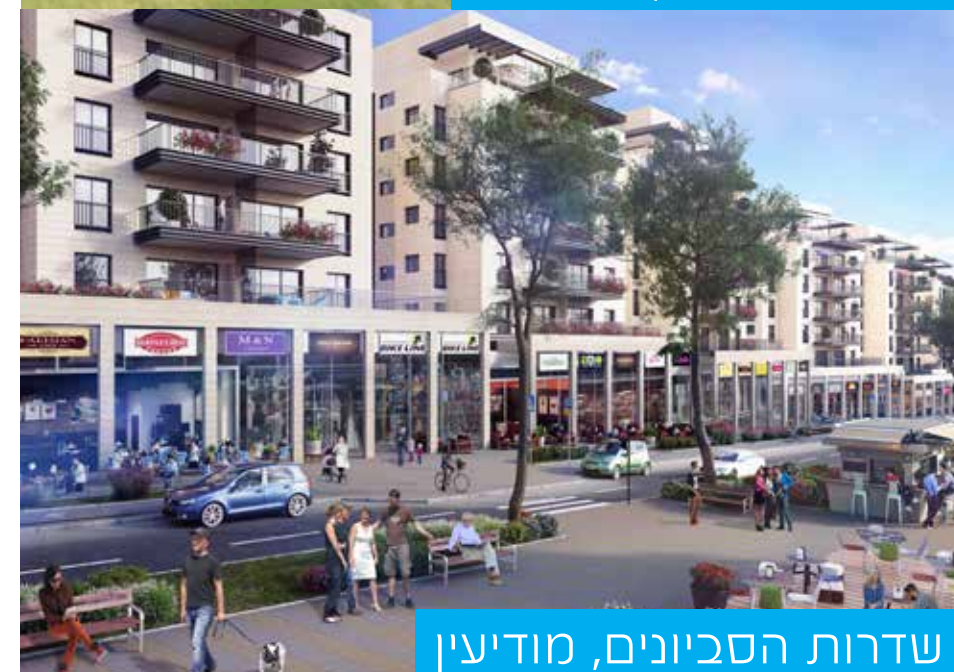
שדרות הסביונים, מודיעין