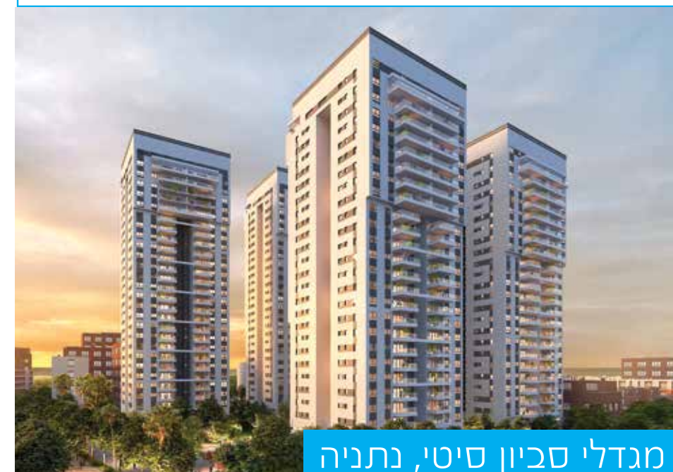
מגדלי סביון סיטי, נתניה