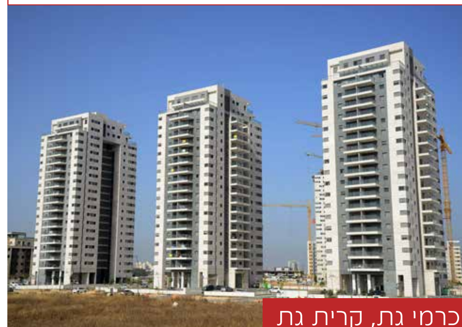
כרמי גת, קרית גת

שכונות הסביונים הן סמל לאיכות חיים. שכונות אלו הפכו למבוקשות במיוחד, בזכות שילוב בין בנייה בסטנדרט גבוה לבין מוסדות חינוך איכותיים, מרכזים מסחריים, מוסדות תרבות ופארקים מטופחים.