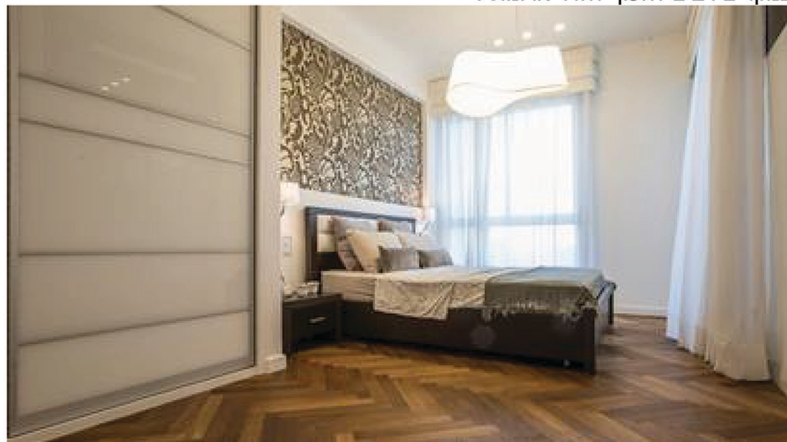
עיצוב דירה של זוג עם ילדים בוגרים שעזבו את הבית הוא "החלום הרטוב של כל מעצב". בדירות כאלה אין מגבלות שטח

גינזבורג מתייחסת לעיצוב דירה של זוג עם ילדים בוגרים שעזבו את הבית כאל "החלום הרטוב של כל מעצב". "בדירות כאלה אין מגבלות שטח, כי הדיירים מעוניינים בחללים גדולים ומרווחים, ואין להם בעיה לוותר על חדרים לטובת הרחבת המטבח והסלון הם רוצים גם חדר רחצה מרווח ומפנק, עם אמבטיית עמידה ואת הממ"ד הם מבקשים במקרים רבים להפוך לחדר ארונות".