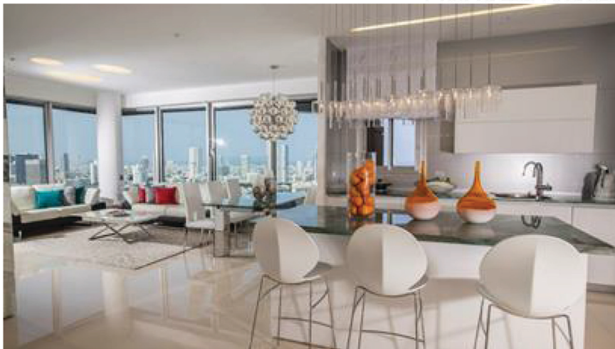
דירה שעוצבה לזוג צעיר

"בעבר אורח החיים של ישראלים היה סתגלני יותר", אומרת דנינו. "רבים הסתפקו בדירה אחת לכל החיים והתאימו את הדירה עצמה לשינויים במצב המשפחתי בתקופות חיים שונות. בעשורים האחרונים, הודות לעלייה ברמת החיים בחברה המערבית בכלל ובחברה הישראלית בפרט ולאור קודים תרבותיים שהשתנו, הישראלים מעדיפים להחליף דירות מספר פעמים במהלך החיים. כיום, רוכשי דירות מחפשים דירה שתתאים בדיוק לשלב שבו הם נמצאים בחיים, מבחינת גיל ומצב משפחתי".