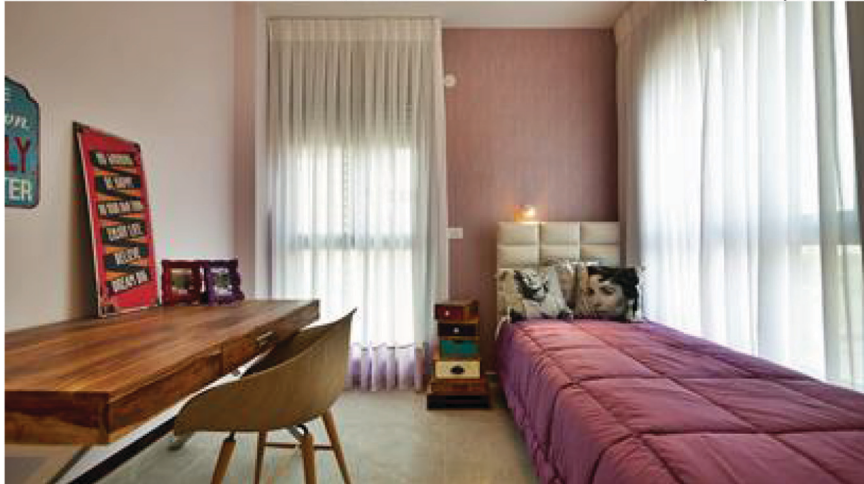
עיצוב צעיר לחדר בפרויקט סביוני גני תקווה - אפריקה ישראל מגורים

"אנחנו מתייחסים לזוגות צעירים או רווקים שרוכשים דירה לראשונה בחייהם כמעגל הראשון של רוכשי דירות", אומרת דנינו. לדבריה: "מדובר ברוכשים עם תקציב מוגבל שעומדים לקראת הקמת משפחה או כבר יש להם ילד אחד. רוכשים כאלה מחפשים דירות קטנות יחסית עם שלושה חדרים או ארבעה חדרים. לרוב חשוב להם שהדירה תהיה בקרבת מקום להורים של אחד מבני הזוג לפחות, כדי שההורים יוכלו לסייע להם בטיפול בילדים".