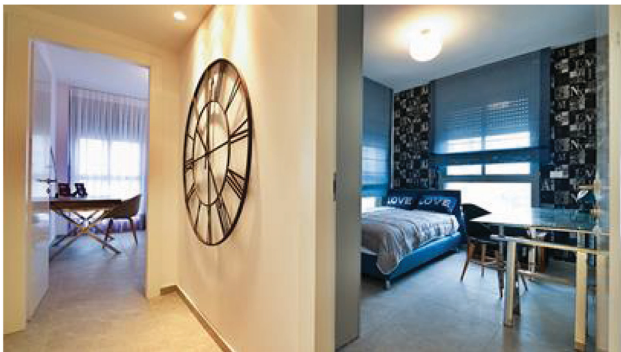
חדר השינה הוא מרכז הבית

גינזבורג מוסיפה שחשוב לייצר פתרונות אחסון נאותים בדירות שמועדות למשפחות עם ילדים. "משפחות כאלה זקוקות להרבה מקום עבור בגדים, נעליים, צעצועים, ספרים ועוד. כדי לחסוך במקום אפשר ליצור נישות אחסון בתוך הקיר במסדרון ואפשר לנצל גם את חדר המשפחה ואת מרפסת השירות ולהציב שם יחידת נגרות מאובזרת, שכוללת גם מגירות סגורות. היתרון הוא שניתן להכניס למגירות בקלות, פריטים מפוזרים וכך לעשות במהירות סדר בבלגן".