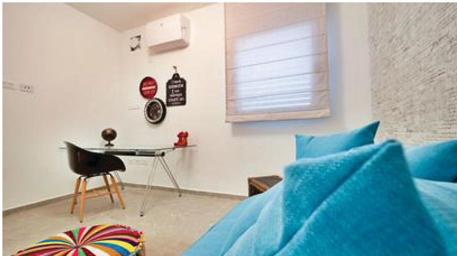
עיצוב חדר ילד בוגר בבית ההורים

"זו בהחלט אפשרות, וניתן גם לסגור את חדר המשפחה במחיצות זכוכית, שיאפשרו להורים לראות את הילדים כשהם שוהים בחדר".