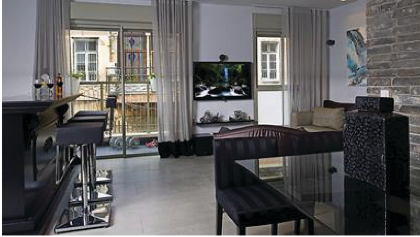
לאיזה שלב בחיים שלכם הדירה הזו מתאימה?