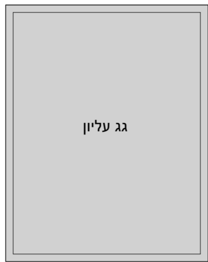
תכנית גג עליון קנה מידה - 1 : 100