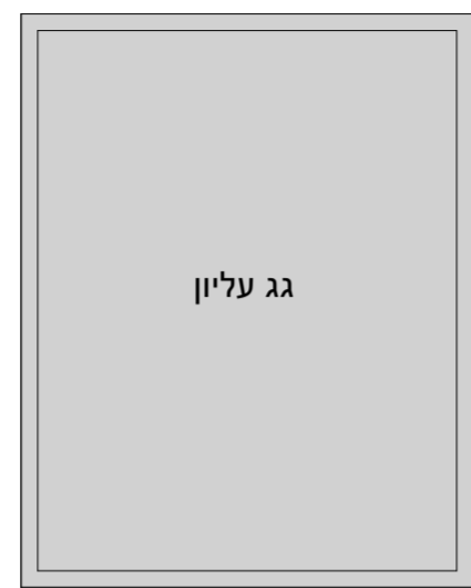
תכנית גג עליון קנה מידה - 1 : 100