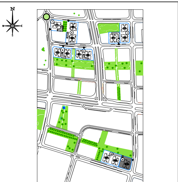
תכנית העמדה סכמטית