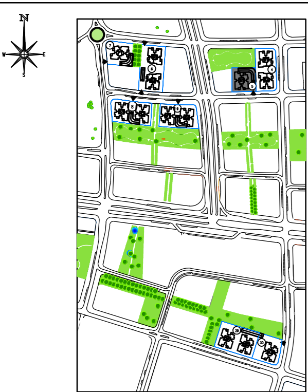
תכנית העמדה סכמטית