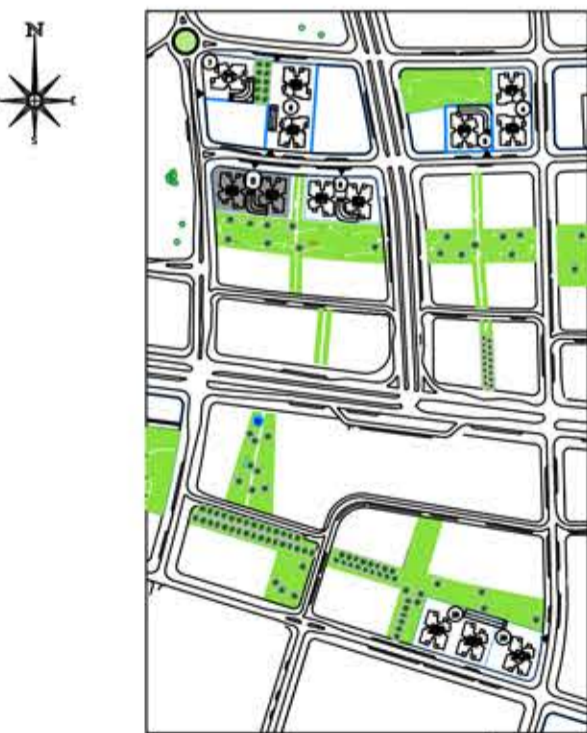
תכנית העמדה סכמטית