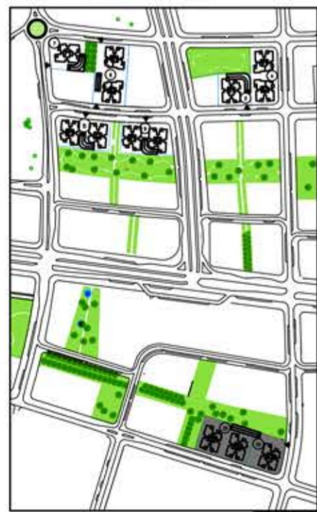
תכנית העמדה סכמטית