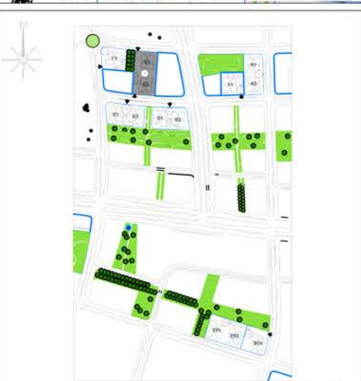
הכניסה המרכזית למתחם

אישור תכנון: 1-200 | תאריך: 05.01.2019 התכנון נעשה לפי דרישות התכנון והתקן 107, תש"פ, וכולל את כל המפרטים הנדרשים להגשת התוכנית לרשות התכנון המקומית.