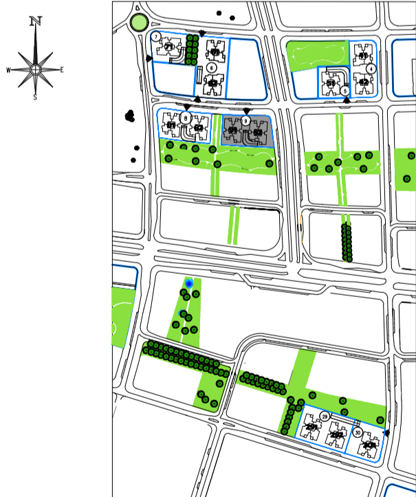
תכנית העמדה סכמטית