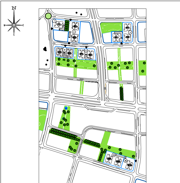
תכנית העמדה סכמטית