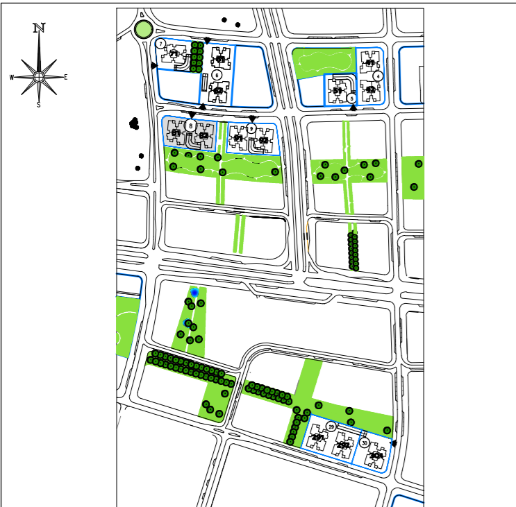
תכנית העמדה סכמטית