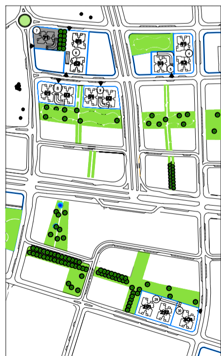
תכנית העמדה סכמטית