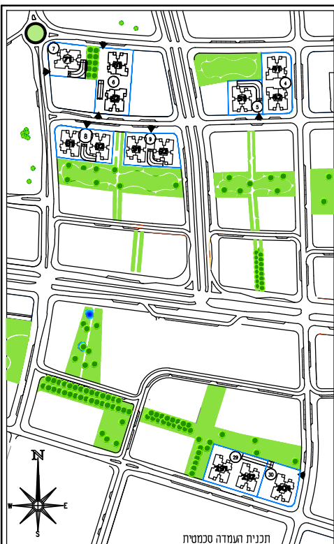
תכנית העמדה סכמטית