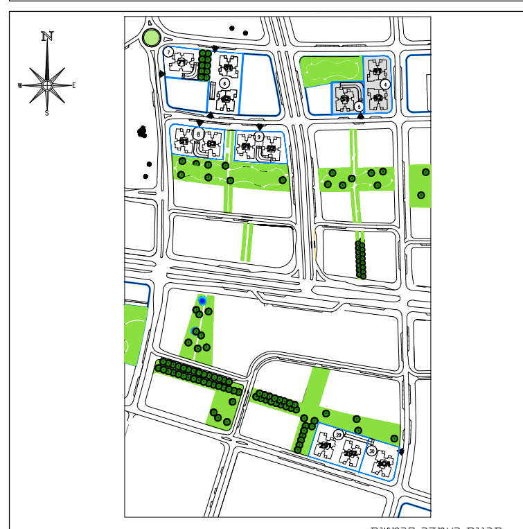
תכנית המעדה סכמטית