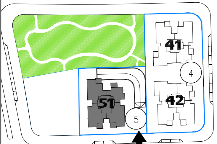
תוכנית העמדה סכמטית