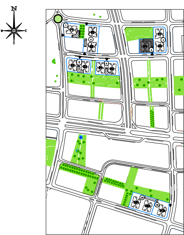
תכנית העמדה סכמטית